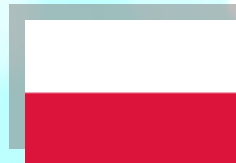
Szkola Podstawowa nr 47 im. J.K. Branickiego